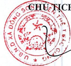
Đặng Quý Hưng