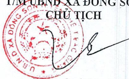
Đặng Quý Hưng