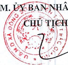
Đặng Quý Hưng